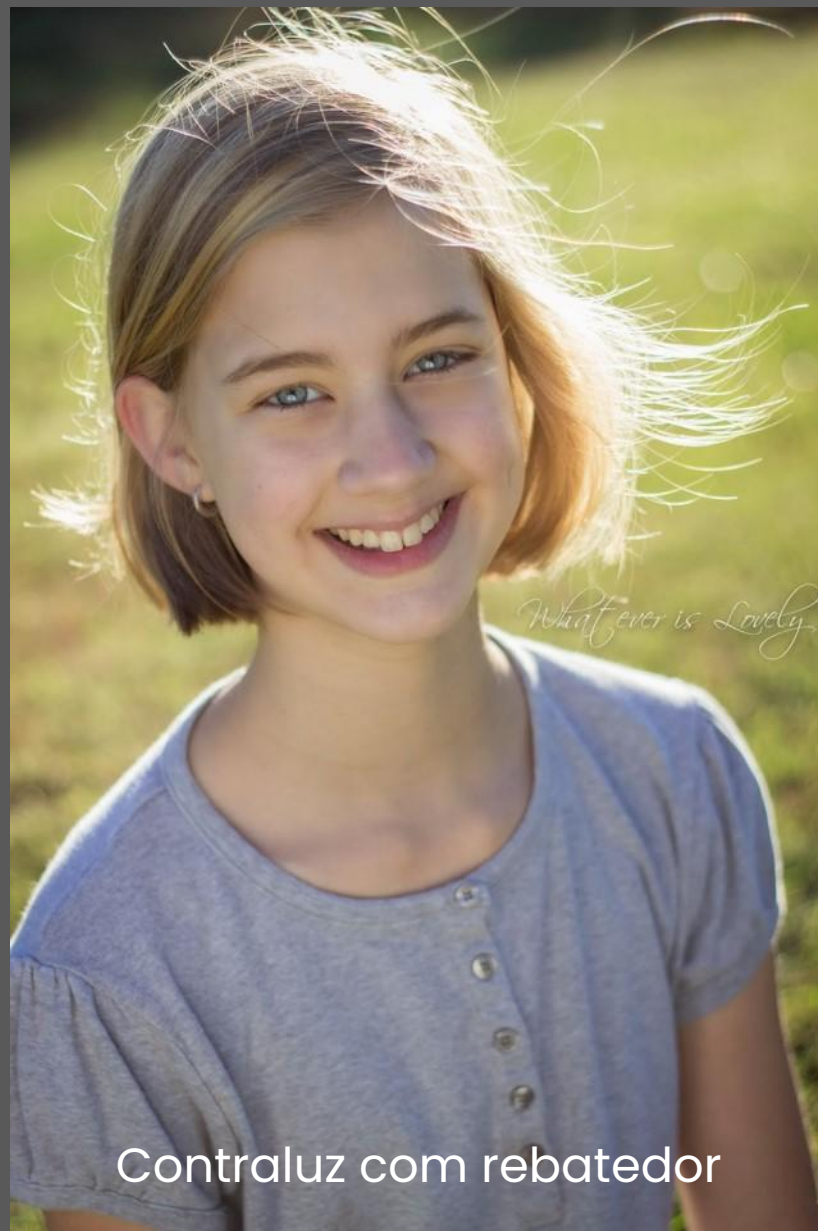
Contraluz com rebatedor