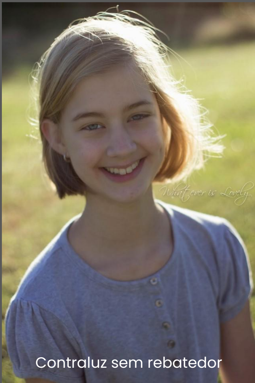
Contraluz sem rebatedor