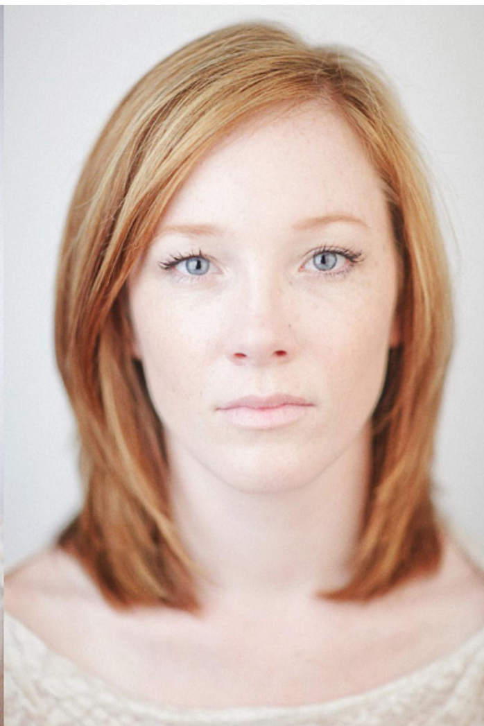
Pro Portrait Lens