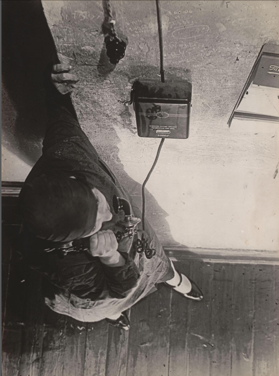
Aleksander Rodchenko, 1928

A Fotografia Moderna nos trouxe uma nova forma de explorar o mundo com o olhar.