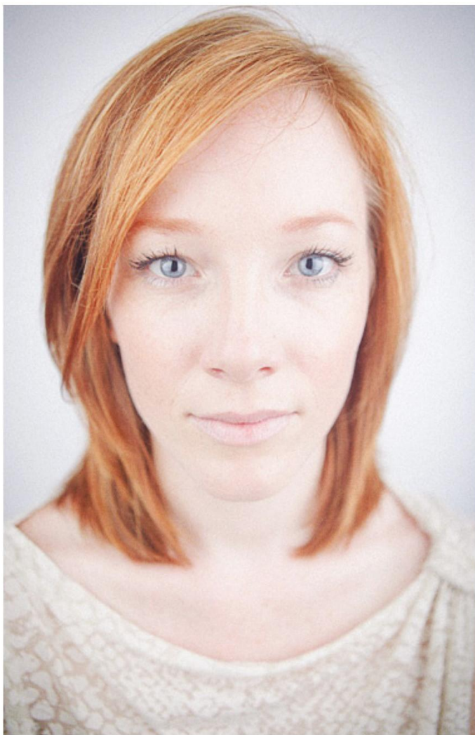
Wide Angle Lens (Smartphone)